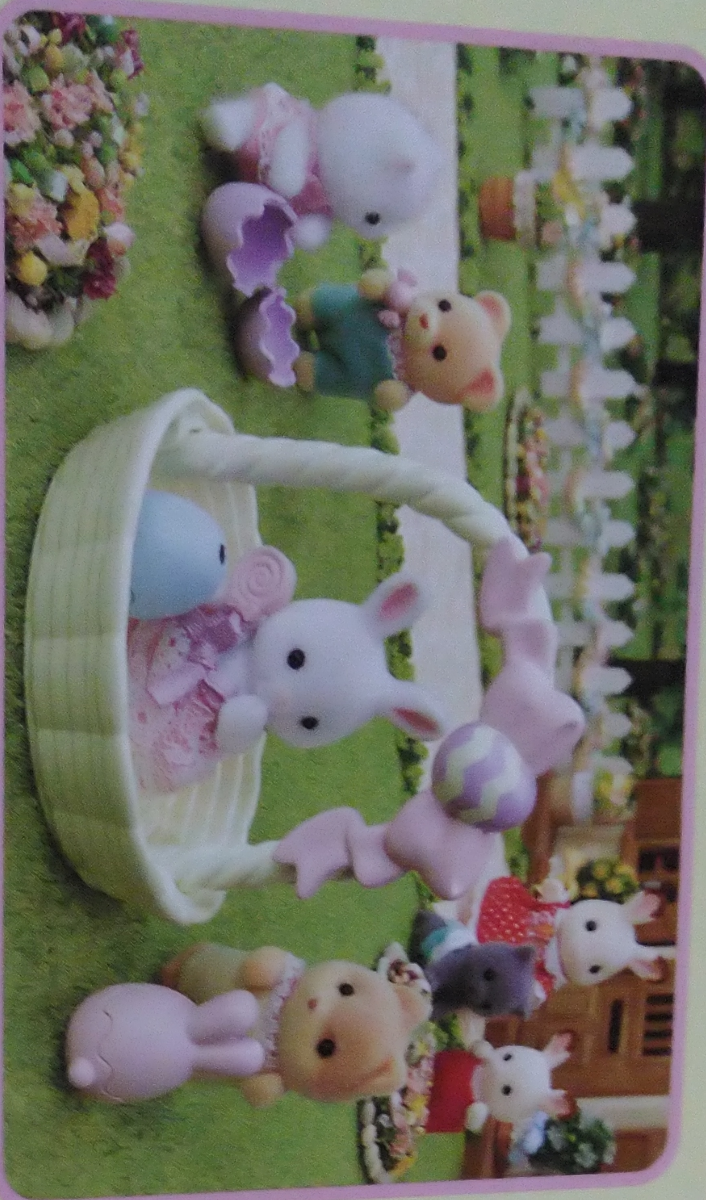
Hoppin' Easter Set