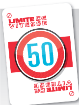
LIMITE DE VITESSE

Cette carte se place sur la pile de Vitesse d'un adversaire. Elle l'empêche de poser des cartes Bornes supérieures à 50 km, jusqu'à ce qu'il recouvre cette attaque d'une carte Fin de Limite de Vitesse.