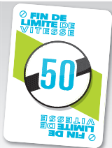
FIN DE LIMITE DE VITESSE