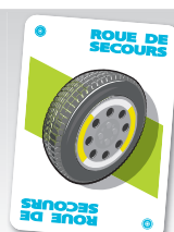
ROUE DE SECOURS