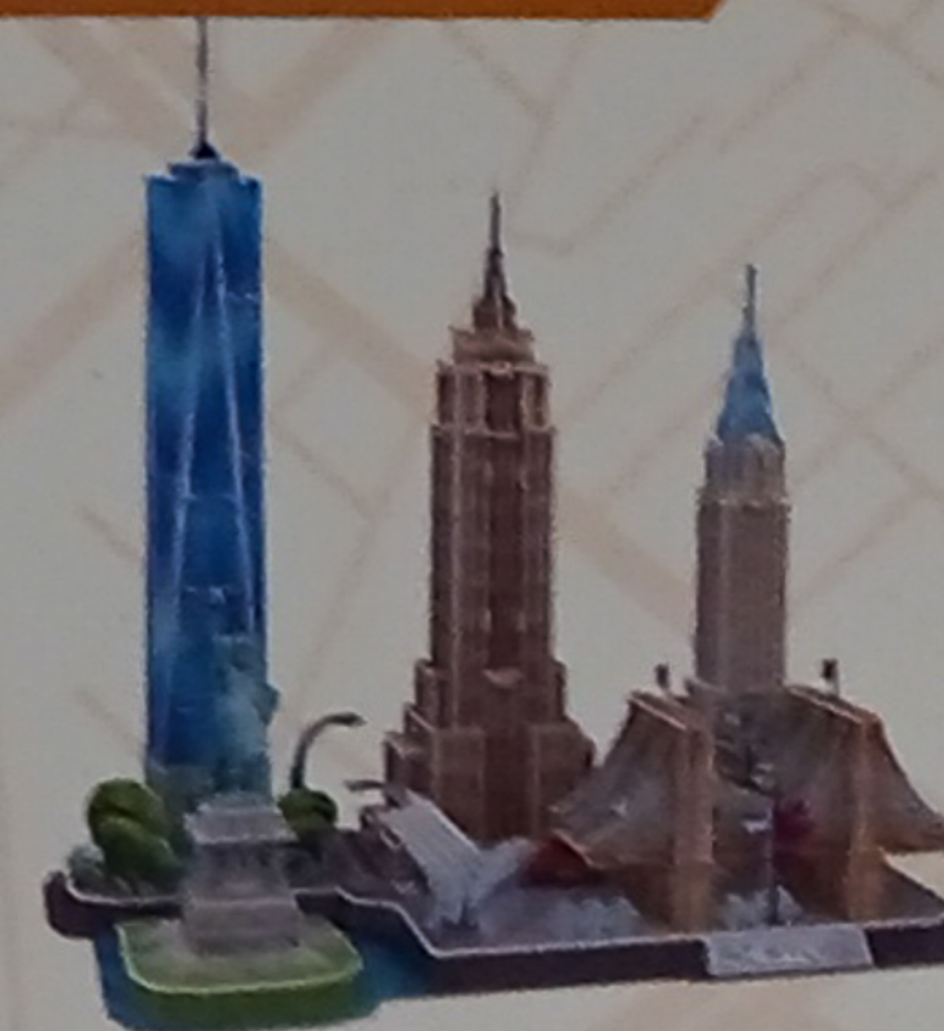
NEW YORK CITY MC255h