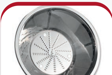
Edelstahl-Mikrosieb stainless steel micro-sieve

Entsafter Saftpresser Centrifugeuse Sapcentrifuge