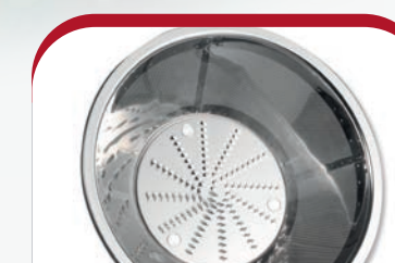
Edelstahl-Mikrosieb stainless steel micro-sieve

Juice extractor Licuadora Centrifuga Sokowirówka