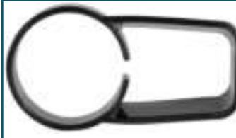
Houder kierzuigmond zwart (1 stuks)