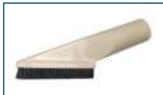
Borstelzuigmond ivoor wit (1 stuks)