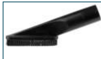
Borstelzuigmond zwart (1 stuks)