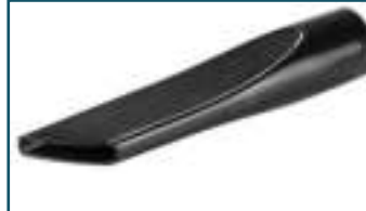
Kierzuigmond kort zwart (1 stuks)