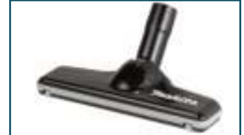
Vloerzuigmond harde vloer zwart (1 stuks)