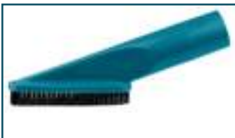
Borstelzuigmond blauw (1 stuks)