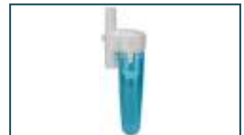
Cycloon voorafscheider wit (1 stuks)