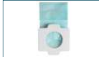
Papieren stofzak steel- en auto stofzuiger (5 stuks)