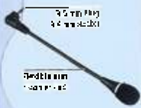
3,5 mm Plug 3,5 mm Socket

✓ Produk ini adalah produk yang diproduksi di Indonesia Produk ini adalah produk yang diproduksi di Indonesia