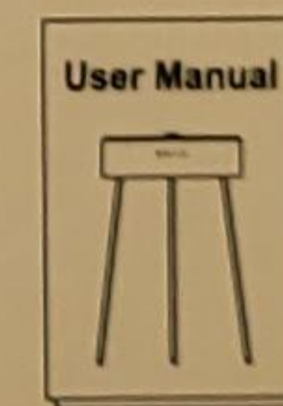
User Manual Bedienungsanleitung