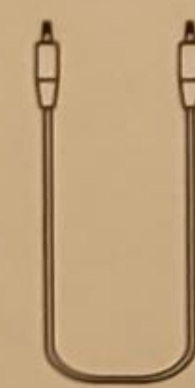
AUX Cable AudioKabel