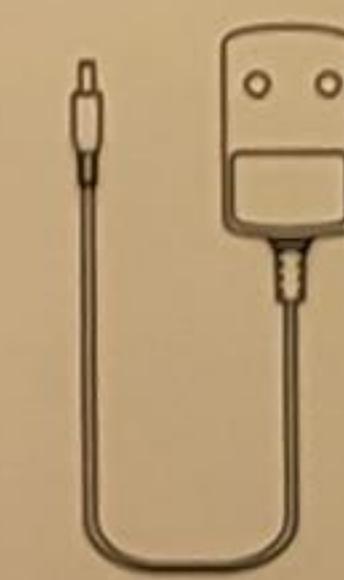
Power Supply Netzteil