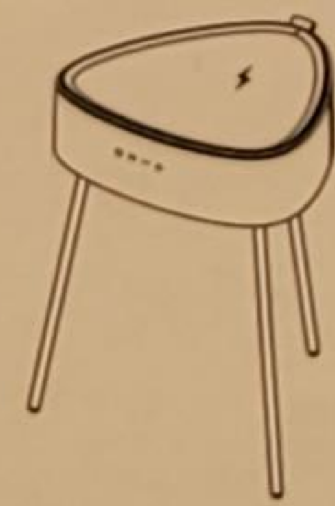
Speaker Table Lautsprecher-Tisch