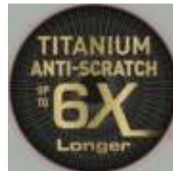
Onze beste krasbestendige Titanium coating

0% PFOA, 0% lood, 0% cadmium** * Strengere controles dan die vereist worden door de huidige regelgeving rondom contact met levensmiddelen. Product bevat geen lood of Cadmium (geen Pb, geen Cd), ook niet in de antiaanbaklaag. Geen migratie op een meetniveau van 0,005 mg/kg.