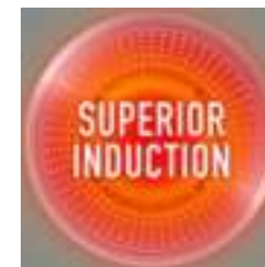
Optimale inductiebodem voor snelle verhitting

Geschikt voor alle warmtebronnen (gas, elektrisch, keramisch) en inductie.