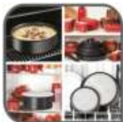
De pan die alles kan!

**Voorkeur geniet om pan met de hand af te wassen, voor een langere levensduur.