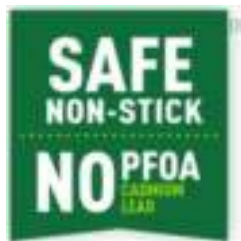
100% Veilige coating

Een verwijderbare handgreep die je met een gerust hart voor het zware werk kunt gebruiken. Het 3-punts veiligheidssysteem is in staat om tot 10 kg te dragen en beschermd door onze 10 jaar garantie. Gemaakt om lang mee te gaan.