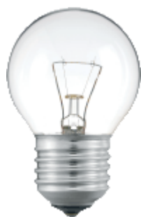
Stan E27 P45 CL