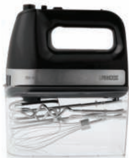
Hand mixer power 500 01.222206.01.001

PARTS DESCRIPTION / ONDERDELENBESCHRIJVING / DESCRIPTION DES PIÈCES / TEILEBESCHREIBUNG / DESCRIPCIÓN DE LAS PIEZAS / DESCRIÇÃO DOS COMPONENTES / DESCRIZIONE DELLE PARTI / BESKRIVNING AV DELAR / OPIS CZĘŚCI / POPIS SOUČÁSTI / POPIS SUČASTI / ОПИСАНИЕ ЗАПЧАСТИ