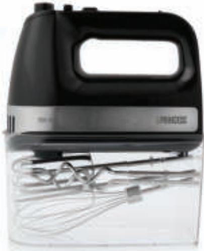
Hand mixer power 500 01.222206.01.001

PARTS DESCRIPTION / ONDERDELENBESCHRIJVING / DESCRIPTION DES PIÈCES / TEILEBESCHREIBUNG / DESCRIPCIÓN DE LAS PIEZAS / DESCRIÇÃO DOS COMPONENTES / DESCRIZIONE DELLE PARTI / BESKRIVNING AV DELAR / OPIS CZĘŚCI / POPIS SOUČÁSTÍ / POPIS SUČASTI / ОПИСАНИЕ ЗАПЧАСТИ