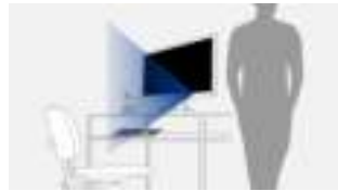
Sensor herkent verlaten werkplek