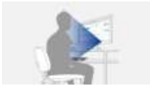
Sensor herkent persoon op werkplek

Met de aanwezigheidssensor (EcoView-Sense) bespaart u stroom en verlaagt u uw energiekosten. Het principe erachter: Als u achter het beeldscherm zit, staat de monitor aan. Als u uw werkplek verlaat, schakelt het beeldscherm automatisch over op de spaarmodus. Zodra u terugkeert, wordt het beeldscherm weer actief, volledig automatisch met behulp van de bewegingssensor.