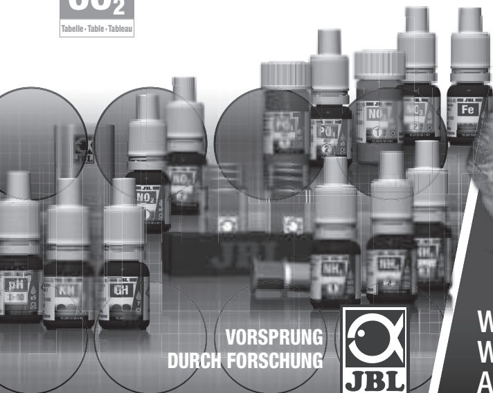
Tabelle • Table • Tableau