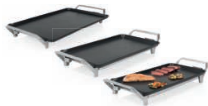
Table Chef Premium Table Chef Premium XL | Table Chef Premium XXL 01.103100.01.001 | 01.103110.01.001 | 01.103120.01.001

PARTS DESCRIPTION / ONDERDELENBESCHRIJVING / DESCRIPTION DES PIÈCES / TEILEBESCHREIBUNG / DESCRIPCIÓN DE LAS PIEZAS / DESCRIÇÃO DOS COMPONENTES / DESCRIZIONE DELLE PARTI / BESKRIVNING AV DELAR / OPIS CZĘŚCI / POPIS SOUČÁSTÍ / POPIS SUČASTÍ / ОПИСАНИЕ ЗАПЧАСТИ