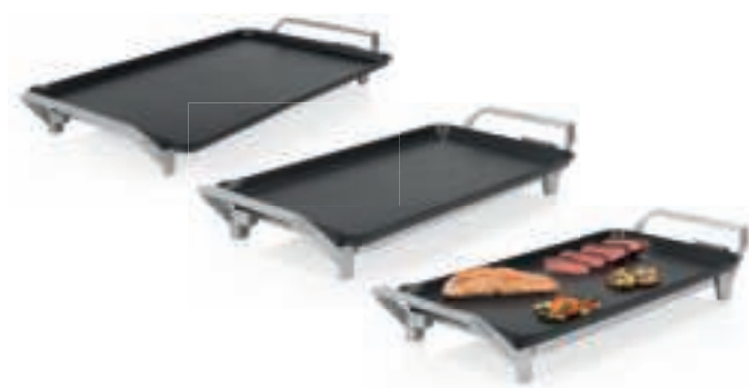
Table Chef Premium Table Chef Premium XL | Table Chef Premium XXL 01.103100.01.001 | 01.103110.01.001 | 01.103120.01.001

PARTS DESCRIPTION / ONDERDELENBESCHRIJVING / DESCRIPTION DES PIÈCES / TEILEBESCHREIBUNG / DESCRIPCIÓN DE LAS PIEZAS / DESCRIÇÃO DOS COMPONENTES / DESCRIZIONE DELLE PARTI / BESKRIVNING AV DELAR / OPIS CZĘŚCI / POPIS SOUČÁSTÍ / POPIS SOUČASTI / ОПИСАНИЕ ЗАПЧАСТИ