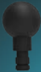
Opzetstuk: Round Ball

Onderstaande opzetstukken worden meegeleverd. Elk opzetstuk heeft een eigen intensiteit niveau en werking. Zo masseert elk opzetstuk een aparte spiergroep en dient het juiste opzetstuk bevestigd te worden, om blessures te voorkomen en het meest optimale resultaat te krijgen!