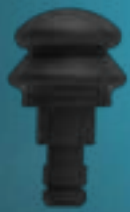
Opzetstuk: Air Plug