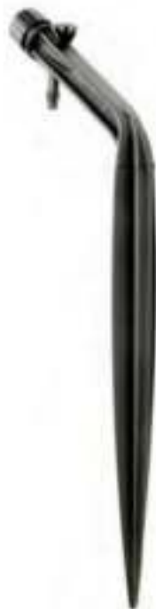
PotStream® Adjustable Flow

Planten in potten, plantenbakken, containers.