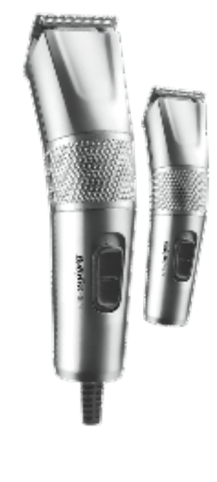
Made in China Fabriqué en Chine

Efter rengøring tændes der for apparatet og skærene smøres med olie ved at dryppe få dråber af den medfølgende olie over skærene. Anvend kun smørolien, der følger med dette produkt, da den er specielt formuleret til højhastighedsklippersere og ikke fordampes eller gør skærene sløve.