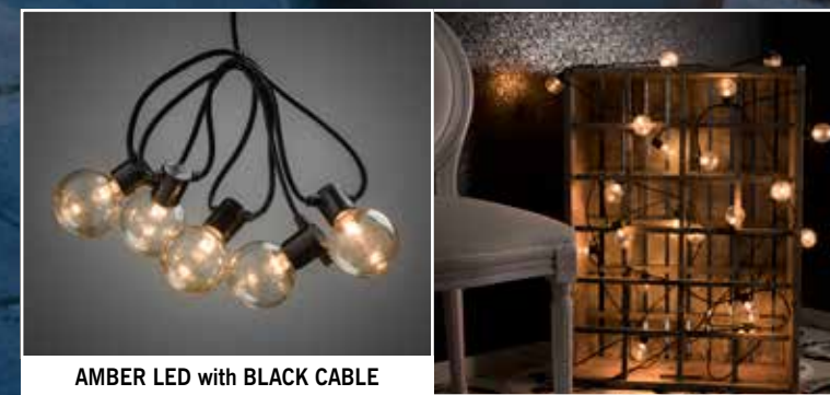
AMBER LED with BLACK CABLE