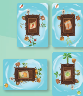
Voorbeeld van een moestuin van 2x2 plantkaarten

Houd de seizoenkaarten apart. Verdeel de overige kaarten in drie stapels: een stapel voor de lente, de zomer en de herfst, te herkennen aan de verschillende achterkanten. In de lente stapel vind je acht kaarten die herkenbaar zijn als de start-plantkaarten. Elke speler krijgt hier twee planten van en plaatst deze voor zich op tafel naast elkaar als start van de eigen moestuin. De start-plantkaarten die overblijven bij minder dan vier spelers worden door de lente-stapel geschud. Planten worden in een rooster in de eigen moestuin gespeeld. Bij twee spelers is dit rooster 3x3 plantkaarten groot, bij drie en vier spelers is het 2x2 plantkaarten groot.