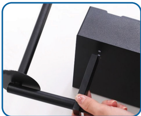
Plaats de samengestelde papierwikkelstang in lijn met het gat onder de opbergdoos.