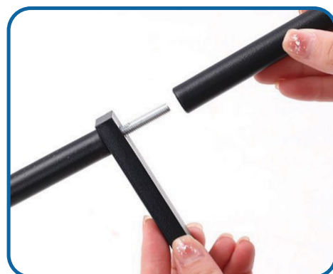
Installeer de korte dwarsstang aan de andere kant.