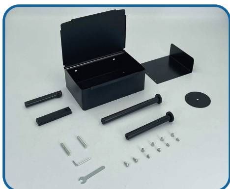
Inhoud van de toiletpapierhouder set inclusief gereedschap.