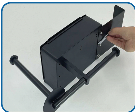
Schroef de schroeven in met een schroevendraaier en monteer het laatste stuk.