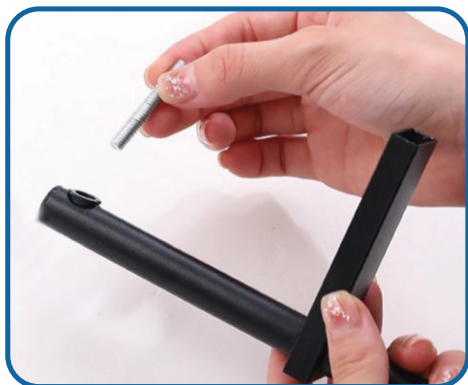
Schroef de helft van de schroeven in aan een kant van de dwarsbalk.