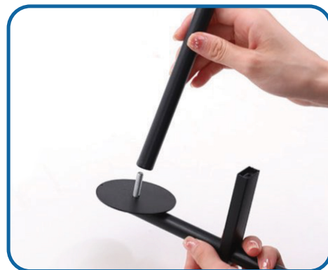
Installeer de lange staaf.