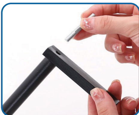
Schroef de helft van de schroeven op de steunstang.