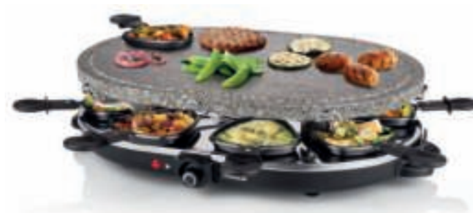
Raclette 8 Oval Stone Grill Party 01.162720.01.001

PARTS DESCRIPTION / ONDERDELENBESCHRIJVING / DESCRIPTION DES PIÈCES / TEILEBESCHREIBUNG / DESCRIPCIÓN DE LAS PIEZAS / DESCRICÃO DOS COMPONENTES / DESCRIZIONE DELLE PARTI / BESKRIVNING AV DELAR / OPIS CZĘŚCI / POPIS SOUČÁSTÍ / POPIS SUČASTI