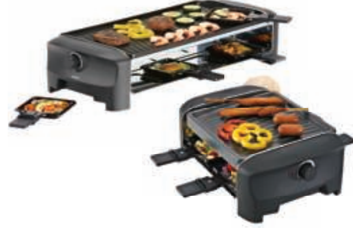
Raclette 4 Grill Party / Raclette 8 Grill and Teppanyaki Party 01.162800.01.001 / 01.162840.01.001

PARTS DESCRIPTION / ONDERDELENBESCHRIJVING / DESCRIPTION DES PIÈCES / TEILEBESCHREIBUNG / DESCRIPCIÓN DE LAS PIEZAS / DESCRIÇÃO DOS COMPONENTES / DESCRIZIONE DELLE PARTI / BESKRIVNING AV DELAR / OPIS CZĘŚCI / POPIS SOUČÁSTÍ / POPIS SUČASTÍ / PARÇALARIN AÇIKLAMASI