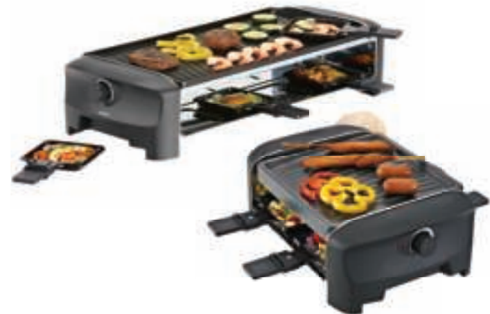
Raclette 4 Grill Party / Raclette 8 Grill and Teppanyaki Party 01.162800.01.001 / 01.162840.01.001

PARTS DESCRIPTION / ONDERDELENBESCHRIJVING / DESCRIPTION DES PIÈCES / TEILEBESCHREIBUNG / DESCRIPCIÓN DE LAS PIEZAS / DESCRIÇÃO DOS COMPONENTES / DESCRIZIONE DELLE PARTI / BESKRIVNING AV DELAR / OPIS CZĘŚCI / POPIS SOUČÁSTI / POPIS SOUČASTI / PARÇALARIN AÇIKLAMASI