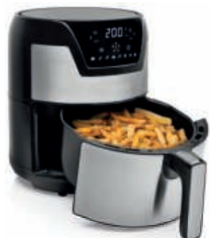
Digital Aerofryer XXL 01.182026.01.001

PARTS DESCRIPTION / ONDERDELENBESCHRIJVING / DESCRIPTION DES PIÈCES / TEILEBESCHREIBUNG / DESCRIPCIÓN DE LAS PIEZAS / DESCRIÇÃO DOS COMPONENTES / DESCRIZIONE DELLE PARTI / BESKRIVNING AV DELAR / OPIS CZĘŚCI / POPIS SOUČÁSTÍ / POPIS SUČASTI / ОПИСАНИЕ ЗАПЧАСТИ