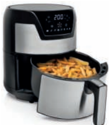
Digital Aerofryer XXL 01.182026.01.001

PARTS DESCRIPTION / ONDERDELENBESCHRIJVING / DESCRIPTION DES PIÈCES / TEILEBESCHREIBUNG / DESCRIPCIÓN DE LAS PIEZAS / DESCRIÇÃO DOS COMPONENTES / DESCRIZIONE DELLE PARTI / BESKRIVNING AV DELAR / OPIS CZĘŚCI / POPIS SOUČÁSTI / POPIS SUČASTI / ОПИСАНИЕ ЗАПЧАСТИ