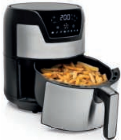
Digital Aerofryer XXL 01.182026.01.001

PARTS DESCRIPTION / ONDERDELENBESCHRIJVING / DESCRIPTION DES PIÈCES / TEILEBESCHREIBUNG / DESCRIPCIÓN DE LAS PIEZAS / DESCRIÇÃO DOS COMPONENTES / DESCRIZIONE DELLE PARTI / BESKRIVNING AV DELAR / OPIS CZĘŚCI / POPIS SOUČÁSTI / POPIS SUČASTI / ОПИСАНИЕ ЗАПЧАСТИ