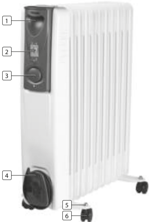
FIGURE 1. / FIGUUR 1. / IMAGÉ 1. / ABBILDUNG 1. / FIGURA 1. / FIGURA 1. / RYSUNEK 1. / FIGURA 1. / FIGUR 1. / OBRÁZOK 1. / OBRÁZOK 1.

PARTS DESCRIPTION / ONDERDELENBESCHRIJVING / DESCRIPTION DES PIÈCES / TEILEBESCHREIBUNG / DESCRIPCIÓN DE LAS PIEZAS / DESCRIÇÃO DOS COMPONENTES / OPIS CZĘŚCI / DESCRIZIONE DELLE PARTI / BESKRIVNING AV DELAR / POPIS SOUČÁSTÍ / POPIS SÚČASTÍ