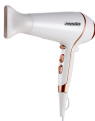
HAIR DRYER MS 2250