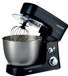
MIXER WITH BOWL MS 4217