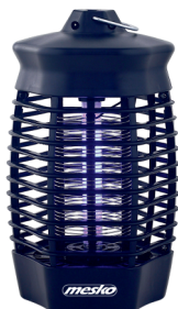
MOSQUITO KILLER LAMP MS 7933