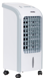
AIR COOLER MS 7914