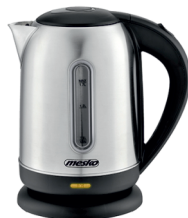
ELECTRIC KETTLE MS 1288