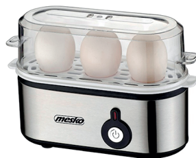
Egg Boiler MS 4485