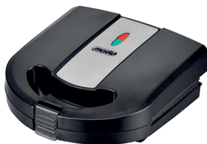
SANDWICH MAKER 3IN1 MS 3045