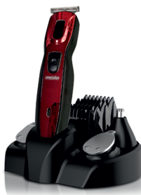
TRIMMER SET MS 2931