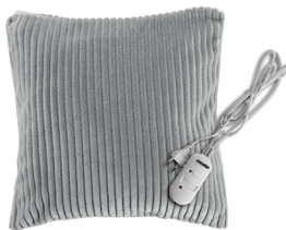
HEATED PAD MS 7429