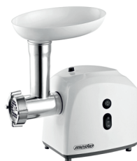
MEAT MINCER MS 4805