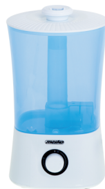
AIR HUMIDIFIER MS 7965