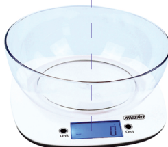
KITCHEN SCALE MS 3165