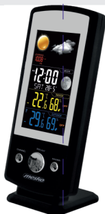
Weather Station MS 1177