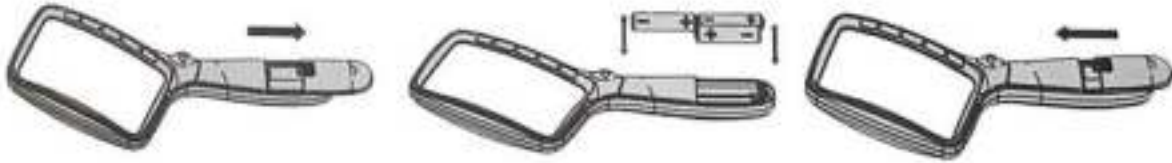
Batterij vak openen