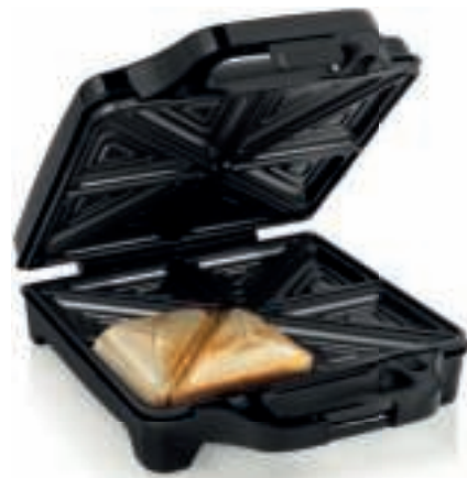
SANDWICH MAKER Supreme XXL 01.127006.01.001

PARTS DESCRIPTION / ONDERDELENBESCHRIJVING / DESCRIPTION DES PIÈCES / TEILEBESCHREIBUNG / DESCRIPCIÓN DE LAS PIEZAS / DESCRIÇÃO DOS COMPONENTES / DESCRIZIONE DELLE PARTI / BESKRIVNING AV DELAR / OPIS CZĘŚCI / POPIS SOUČÁSTÍ / POPIS SÚČASTÍ / ОПИСАНИЕ ЗАПЧАСТІ