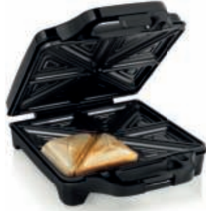
SANDWICH MAKER Supreme XXL 01.127006.01.001

PARTS DESCRIPTION / ONDERDELENBESCHRIJVING / DESCRIPTION DES PIÈCES / TEILEBESCHREIBUNG / DESCRIPCIÓN DE LAS PIEZAS / DESCRIÇÃO DOS COMPONENTES / DESCRIZIONE DELLE PARTI / BESKRIVNING AV DELAR / OPIS CZĘŚCI / POPIS SOUČÁSTI / POPIS SÚČASTI / ОПИСАНИЕ ЗАПЧАСТИ