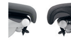
Standaardbekleding (links) Comfortbekleding (rechts) Rembourrage standard (à gauche), rembourrage confort (à droite)