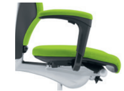
1D-armleuningen* bekleed Accoudoirs 1D* rembourrés