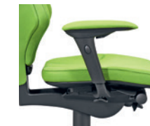
4D-armleuningen* bekleed Accoudoirs 4D* rembourrés

* 1D = hoogte verstelbaar réglable en hauteur 4D = hoogte-, breedte- en diepte verstelbaar réglable en hauteur, en largeur et en profondeur