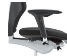
4D-armleuningen* onbekleed Accoudoirs 4D* non rembourrés