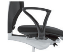
Vaste armleuningen onbekleed Accoudoirs fixes, non rembourrés

Toutes les possibilités de configuration vous sont proposées par le configurateur en ligne sur le site www.giroflex.com