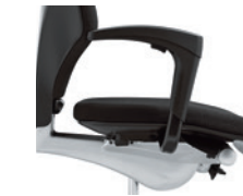
1D-armleuningen* onbekleed Accoudoirs 1D* non rembourrés