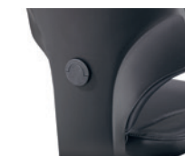
Diepte instelbare lendensteun Soutien lombaire réglable en profondeur

* 1D = hoogte verstelbaar réglable en hauteur 4D = hoogte-, breedte- en diepte verstelbaar réglable en hauteur, en largeur et en profondeur