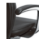
Armleuningen gepolijst Accoudoirs, rembourrés