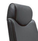
Hoofdsteun vast Appuie-tête, fixe

giroflex 64 – Bureaustoel: de directiefauteuil is verkrijgbaar met comfortbekleding, brede zitting, hoge rugleuning (desgewenst bekleed). Optioneel met in diepte verstelbare lendensteun. Diverse bekledingsmaterialen in verschillende kleuren. Leverbaar met vaste of 3D-armleuningen, hoofdsteun in twee verschillende uitvoeringen en met kleeerhanger. Vijfarmige voet in gepolijst aluminium of met poedercoating in diverse kleuren. Wielen ø 50 mm of optioneel ø 65 mm.