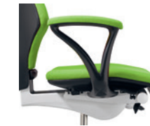
Vaste armleuningen bekleed Accoudoirs fixes rembourrés