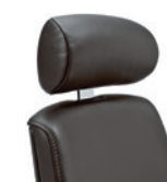
Hoofdsteun verstelbaar Appuie-tête, réglable