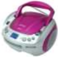
CD/MP3 player (boombox) CR 1123