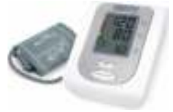
Arm blood pressure monitor CR 8409