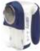
Lint remover CR 9606