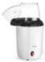
Popcorn maker CR 4458