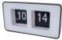
Auto-flip clock CR 1131