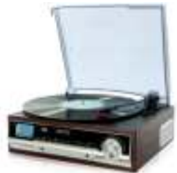
Turntable with radio CR 1113