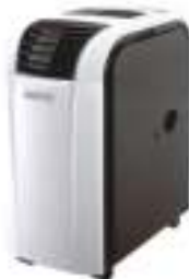
Air conditioner CR 7902