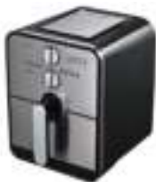
Air fryer CR 6306