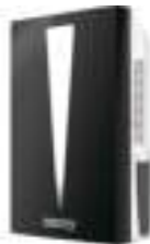
Air dehumidifier CR 7903