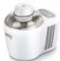
Ice Cream Maker CR 4481