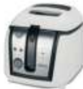
Deep fryer CR 4907