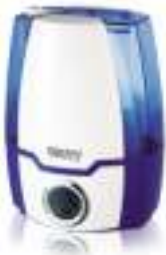
Air humidifier CR 7952