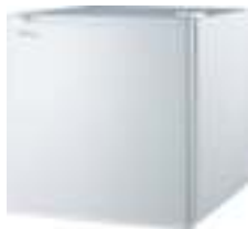
Aggregate refrigerator CR 8064