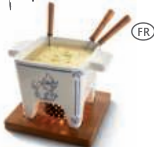
DUTCH COLLECTION 85-35-32 - SET À FONDUE Tapas , Delft Blue , 400gr.

Caquelon en céramique, planche en bois d'acajou, anneau métallique, 4 fourchettes et 1 bougie chauffe-plat.