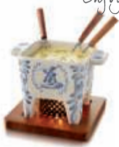
DUTCH COLLECTION 85-35-38 - FONDUE SET Tapas , Delft Blue , 400gr.

Kaasfonduepan van aardewerk, mahoniehouten plank, metalen ring, 4 vorkjes en 1 waxinelichtje