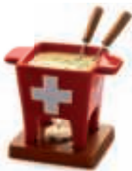
TASTE COLLECTION 85-35-27 - FONDUE SET Tapas , Swiss , 200gr.

Käsefonduetopf aus Steingut, Mahagonibrett, 2 Gabeln und 1 Teelicht