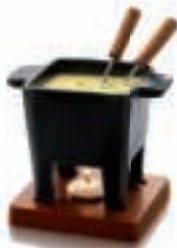
TASTE COLLECTION 85-35-30 - FONDUE SET Tapas , SCHWARZ, 200gr.

Besitzer in der vierten Generation, Martijn Bos