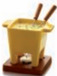
TASTE COLLECTION 85-35-31 - FONDUE SET Tapas , GELB, 200gr.

Käsefonduetopf aus Steingut, Mahagonibrett, 2 Gabeln und 1 Teelicht