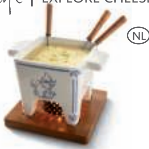
DUTCH COLLECTION 85-35-32 - FONDUE SET Tapas , Delft Blue , 400gr.

Kaasfonduepan van aardewerk, mahoniehouten plank, metalen ring, 4 vorkjes en 1 waxinelichtje