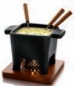
TASTE COLLECTION 85-35-29 - SET À FONDUE Tapas , NOIR, 400gr.

Caquelon en céramique, planche en bois d'acajou, anneau métallique, 4 fourchettes et 1 bougie chauffe-plat.