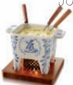
DUTCH COLLECTION 85-35-38 - SET À FONDUE Tapas , Delft Blue , 400gr.

Caquelon en céramique, planche en bois d'acajou, anneau métallique, 4 fourchettes et 1 bougie chauffe-plat.