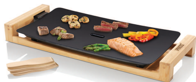
TABLE CHEF PURE Black