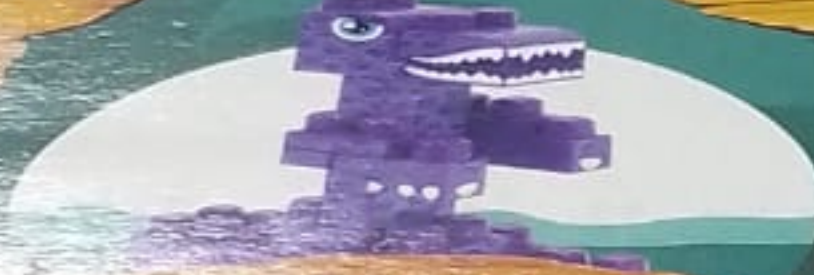
T-REX 17 PCS