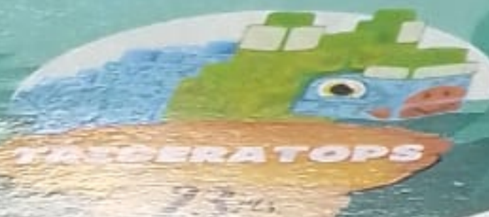
TRICERATOPS 17 PCS