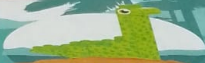
DIPLODOCUS 17 PCS