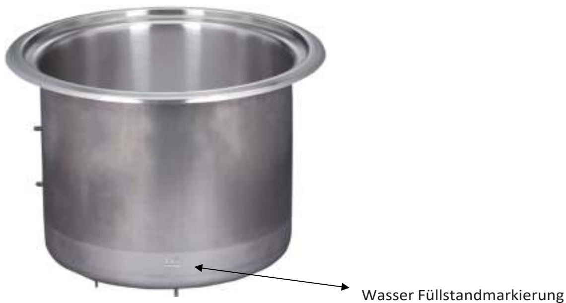
Abbildung 1. Wasser Füllstandmarkierung