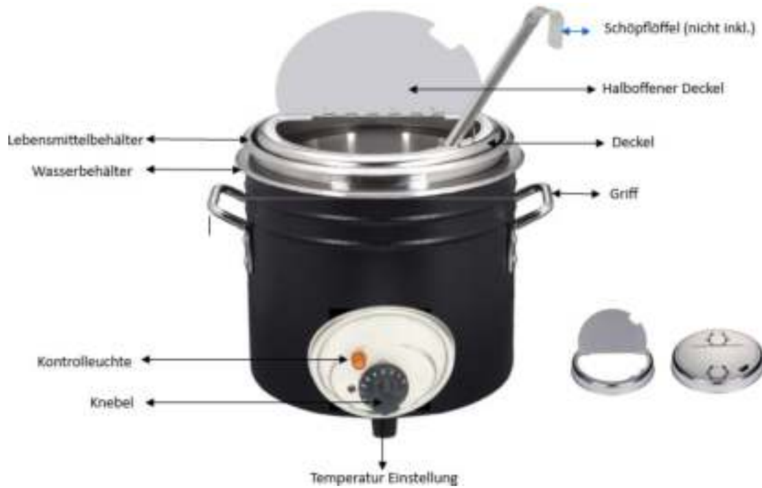
Abbildung 2. Teilebezeichnung.