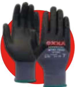
NITRI-TECH 14-692 Art. nr. 1.14.692.00