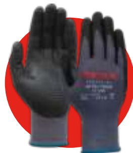
NITRI-TECH 14-695 Art. nr. 1.14.692.00