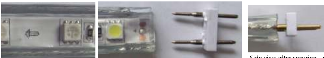
Side view after securing of the 2-pin connector

Secure the 2-pin connector to the strip first. Pay attention that the 2 pins touch tightly to the 2 wires of the strip.