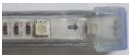
→ Tampa final