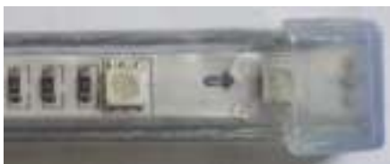
→ Tapa del extremo