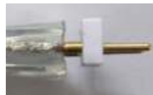
Vista lateral tras asegurar el conector de 2 pines

Asegurar primero el conector de 2 pines a la tira. Prestar atención ya que los dos pines deben tocar firmemente a los dos conductores de la tira.