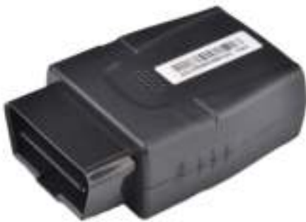
OBD GPS Cloud Connector

U krijgt toegang tot TITC nadat u een GPS box heeft aangeschaft via TITC. TITC biedt meerdere typen GPS boxen.