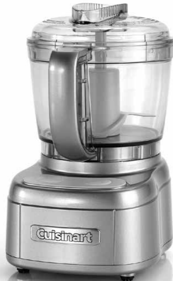
MINI PREP PRO ECH4 Series Q158A