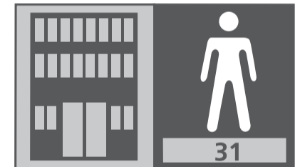
Licht commercieel gebruik