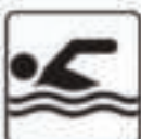
Figure 20 - Swimmers only / Nur für Schwimmer / Solo nuotatori / Solo nadadores / Tylko pływacy / Bare svømmere / Endast simmare / Только пловцы / Apenas nadadores / Alleen voor zwemmers / Nageurs seulement