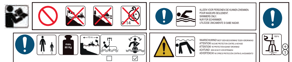
Type: SE Pink Airbed with Red Dots with Glitters