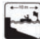
Figure 31 - Only use within 10 meters of the shore / Nur innerhalb von 10 Metern vom Ufer verwenden / Utilizzare solo entro 10 metri dalla riva / Utilizar solo a 10 metros de la orilla / Używaj tylko w odległości 10 metrów od brzegu / Bruk bare innen 10 meter fra kysten / Använd endast inom 10 meter från stranden / Используйте только в пределах 10 метров от берега / Use somente dentro de 10 metros da costa / Gebruik alleen binnen 10 meter van de kust / Utilisez uniquement à moins de 10 mètres du rivage

Das Gerät wird mit einem Reparaturpatch geliefert. Wenn Sie wissen, wo das Leck ist, verwenden Sie eine Mischung aus Spülmittel und Wasser in einer Sprühflasche und sprühen Sie über den verdächtigen Bereich. Bei einem Leck entstehen Blasen, die den Ort des Lecks bestimmen. Reinigen Sie den Bereich um das Leck gründlich, um Schmutz oder Schmutz zu entfernen. Schneiden Sie ein Reparaturpflaster aus, das groß genug ist, um den beschädigten Bereich um etwa 1,5 cm zu überlappen. Runden Sie die Kanten ab und legen Sie das Pflaster auf die beschädigte Stelle und drücken Sie es fest nach unten. Sie können ein Gewicht darauf verwenden, um es an Ort und Stelle zu halten. Pumpen Sie sich nicht innerhalb einer Stunde nach dem Patchen auf. Wenn das Pflaster nicht hält, können Sie Kleber auf Silikon- oder Polyurethanbasis für die Reparatur von Campingmatten, Zelten oder Schuhen in Ihrem örtlichen Geschäft oder Markt kaufen, um das Gerät zu patchen. Bitte beachten Sie die Anweisungen des Klebers zum Patchen.