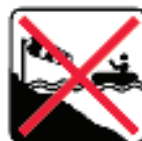
Figure 13 - Do not use in offshore wind / Verwenden Sie nicht bei Offshore-Wind / Non usare in caso di vento offshore / No usar en energía eólica marina / Nie używaj przy morskiej energii wiatrowej / Ikke bruk i havvind / Använd inte i vindkraft / Не использовать при оффшорном ветре / Não use em vento offshore / Niet gebruiken met harde wind / Ne pas utiliser dans l'éolien offshore