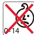
Figure 17 - Not for children 14 years of age and below / Nicht für Kinder unter 14 Jahren / Non per bambini di età pari o inferiore a 14 anni / No apto para niños menores de 14 años / Nie dla dzieci w wieku 14 lat i poniżej / Ikke for barn 14 år og under / Ej för barn 14 år och under / Не для детей 14 лет и младше / Não para crianças de 14 anos de idade e abaixo / Niet voor kinderen met de leeftijd van 14 of lager / Pas pour les enfants de 14 ans et moins