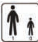
Figure 21 - Numbers of users, adults, children / Anzahl der Benutzer, Erwachsene, Kinder / Numero di utenti, adulti, bambini / Número de usuarios, adultos, niños / Liczba użytkowników, dorosłych, dzieci / Antall brukere, voksne, barn / Antal användare, vuxna, barn / Количество пользователей, взрослых, детей / Número de usuários, adultos, crianças / Aantal gebruikers, volwassenen, kinderen / Nombre d'utilisateurs, adultes, enfants