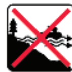
Figure 14 - Do not use in offshore current / Nicht bei Offshore-Strom verwenden / Non usare in corrente offshore / No usar en corriente costa afuera / Nie stosować w prądach morskich / Ikke bruk i offshore strøm / Använd inte i offshore ström / Не использовать в офшорном токе / Não use em corrente offshore / Niet gebruiken in offshore-stroom / Ne pas utiliser dans le courant offshore