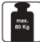
Figure 28 - Max. Load capacity. / maximale Tragfähigkeit / capacità di carico massima / capacidad de carga máxima / maksymalna ładowność / maks belastningskapasitet / max lastkapacitet / максимальная грузоподъемность / capacidade de carga máxima / Maximale draagkracht / Max. La capacité de charge