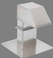
wand- en dakdoorvoeren