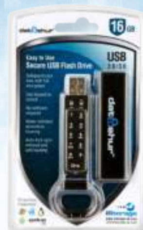
Conditionnement pour la vente au détail