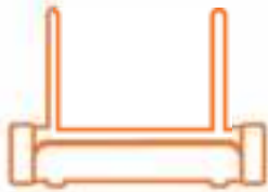
1x Security Shuttle