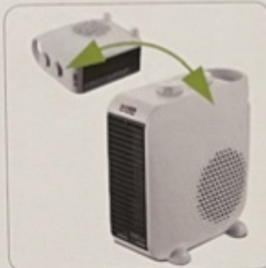
Horizontal or vertical positioning