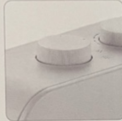
Switch (OFF, FAN, I - Low, II - High)