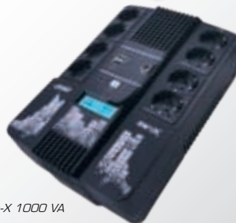
Zen-X 1000 VA