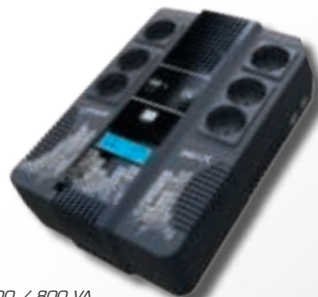
Zen-X 600 / 800 VA