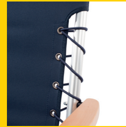
BACK AND SEAT WITH ELASTIC CORD