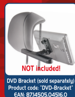
NOT included! DVD Bracket (sold separately) Product code: DVD-Bracket EAN: 8714505 04516 0