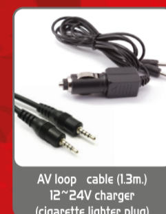
AV loop cable (1.3m.) 12-24V charger (cigarette lighter plug)