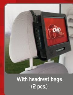
With headrest bags (2 pcs.)