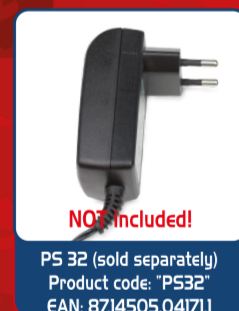
NOT included! PS 32 (sold separately) Product code: PS32 EAN: 8714505 04771 0