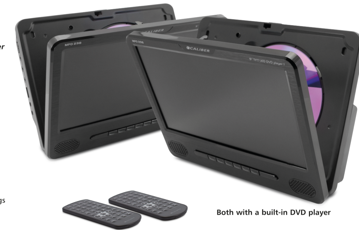
Both with a built-in DVD player

Size player (closed): 190(W) x 145(H) x 37(D) mm