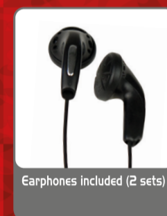
Earphones included (2 sets)