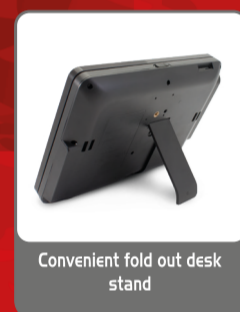
Convenient fold out desk stand