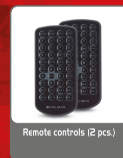
Remote controls (2 pcs.)