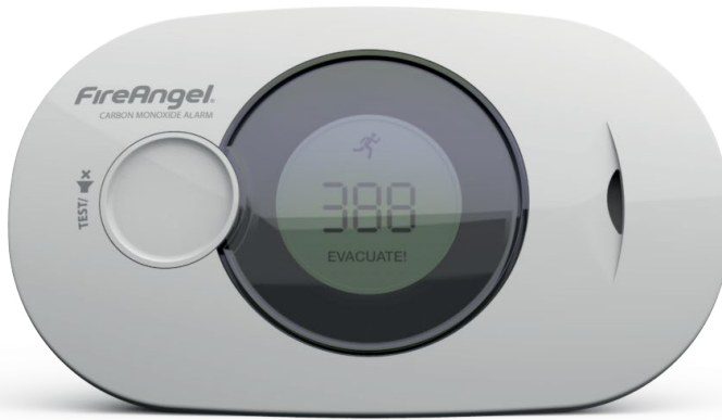
let op: logo en markeringen kunnen per EU land verschillen