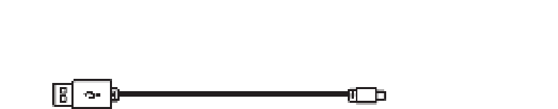
Een USB naar Micro-USB charging cable