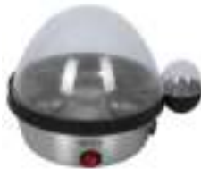
Egg Boiler CR 4482