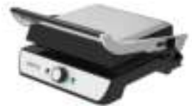
Electric Grill CR 6609