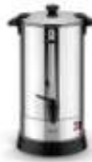
Electric Boiler CR 1267