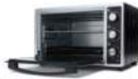
Electric Oven CR 6018