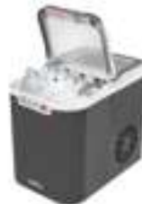
Ice Cube Maker CR 8073