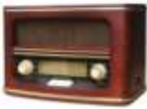
Retro Radio CR 1103