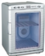
Mini-fridge CR 8062