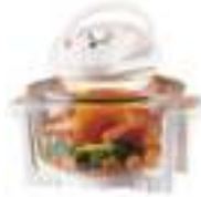
Halogen Oven CR 6305