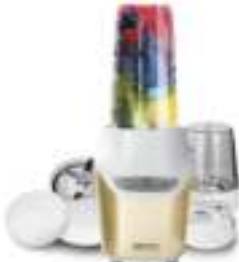
Personal Blender CR 4071