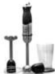
Hand blender CR 4612