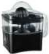
Citrus juicer CR 4001