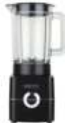
Blender CR 4050