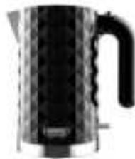
Electric Kettle CR 1269