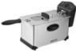
Deep Fryer CR 4909