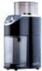
Burr Coffe Grinder CR 4439