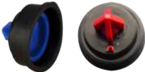
WISA membraam blauw WISA membraam rood